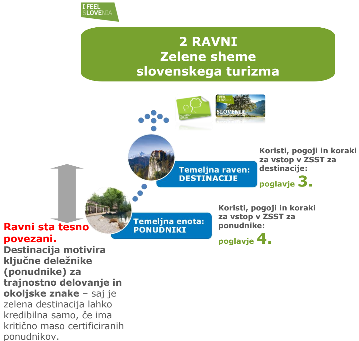
Shema št. 1: Prikaz dveh ravni delovanja ZSST